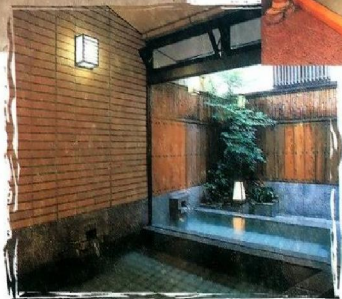
・長薬（露天風呂、ジャグジー付き） おさく「胡蝶」と「長薬」は朝夕、入れ替えてご利用いただけます。